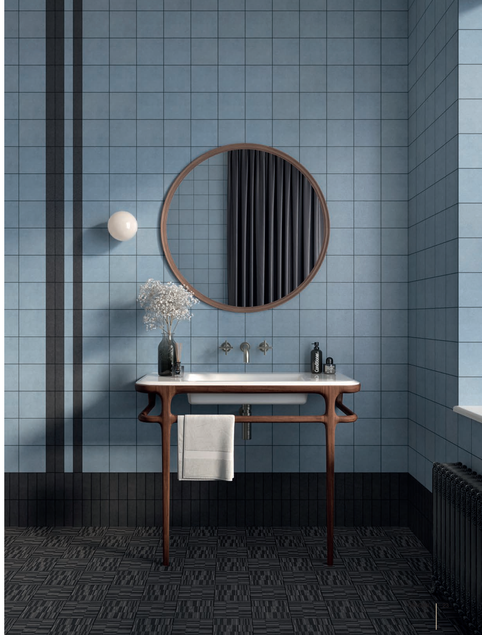
wall: ORIGINI CARBON . 5x15 / 2"x6" - AQUA . 15x15 / 6"x6" floor: CARBON 4 OWU 15x15 / 6"x6"