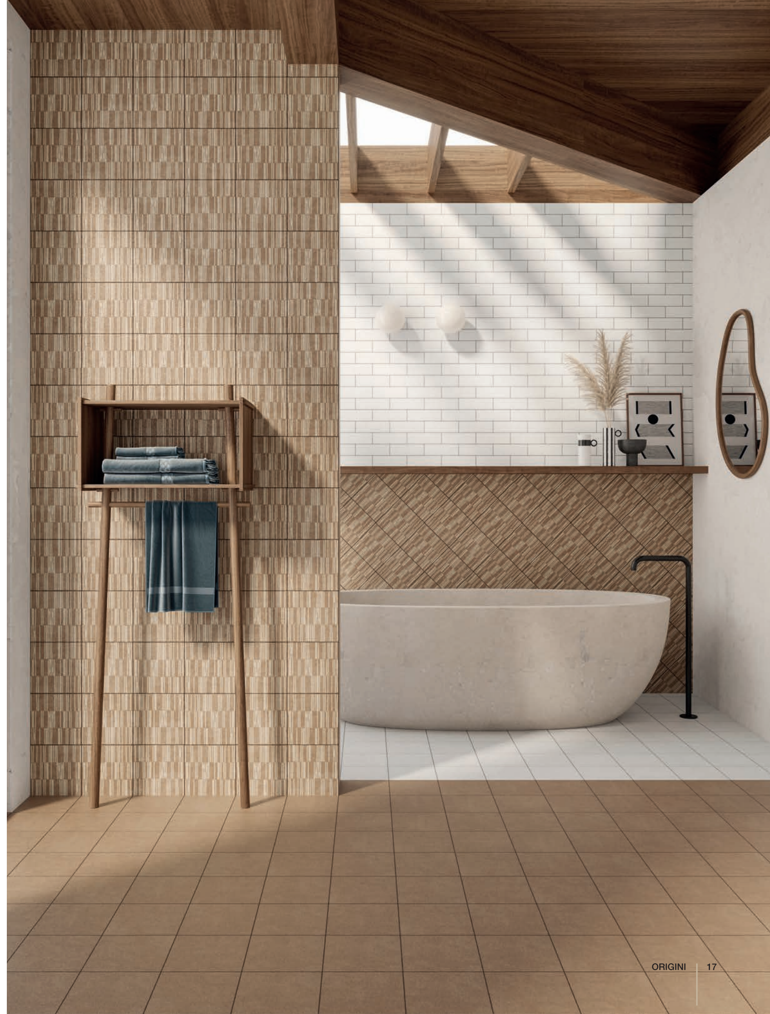
wall: ORIGINI ICE . 5x15 / 2"x6" - CLAY 4 OWU15x15 / 6"x6" floor: ORIGINI ICE - CLAY . 15x15 / 6"x6"