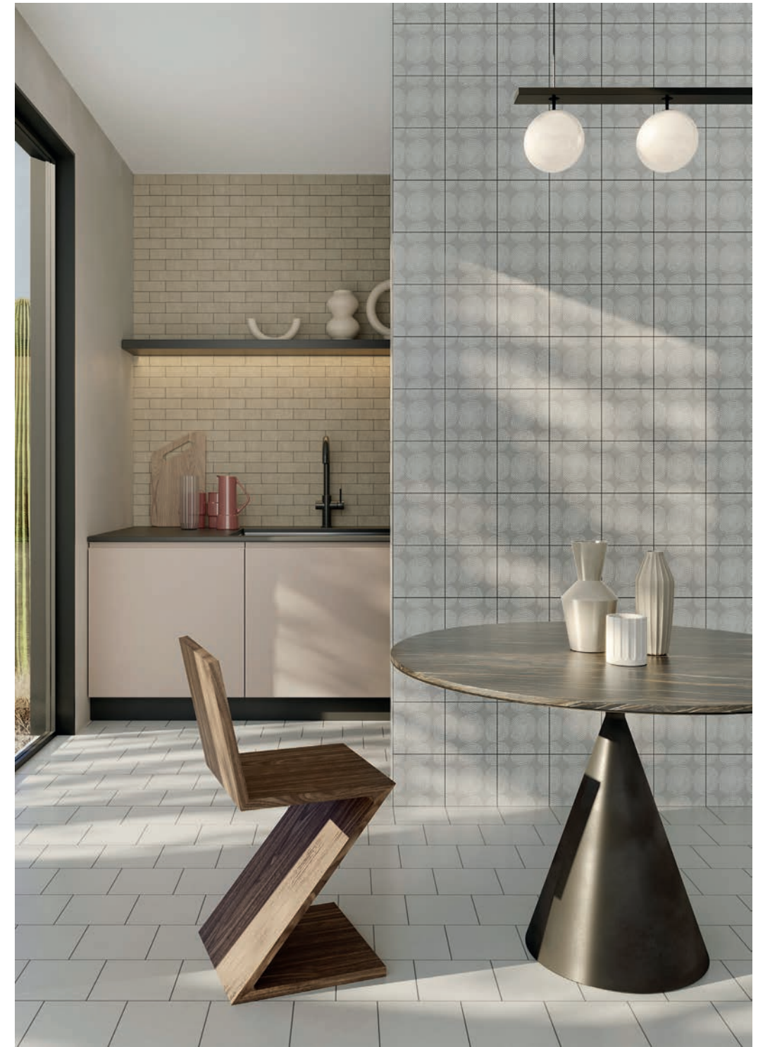
wall: ORIGINI SAND . 5x15 / 2"x6" - CLOUD 3 GOMBO 15x15 / 6"x6" floor: ORIGINI ICE . 15x15 / 6"x6"