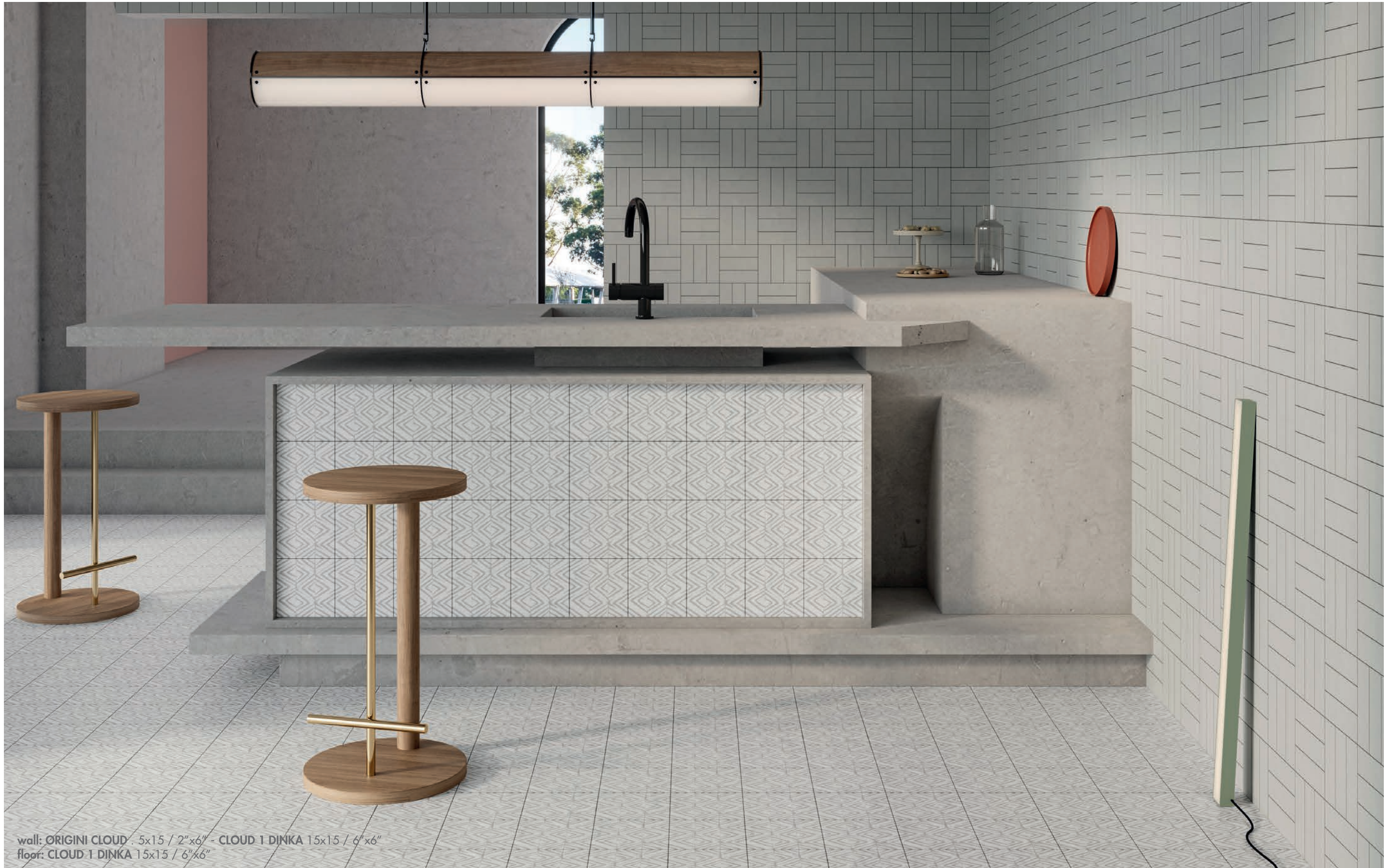
wall: ORIGINI CLOUD . 5x15 / 2"x6" - CLOUD 1 DINKA 15x15 / 6"x6" floor: CLOUD 1 DINKA 15x15 / 6"x6"