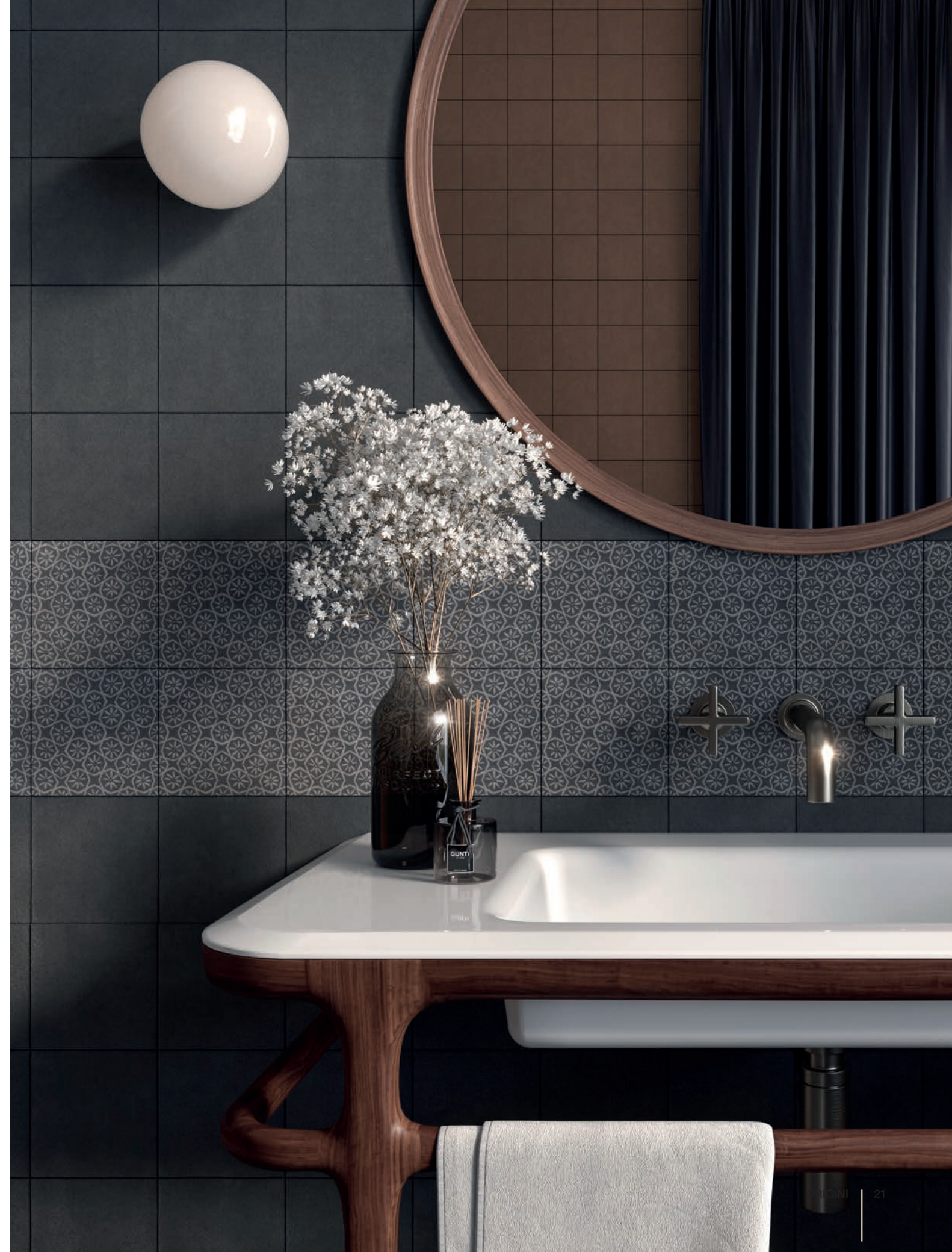
wall: ORIGINI CARBON . 15x15 / 6"x6" - CARBON 2 MAUA 15x15 / 6"x6"