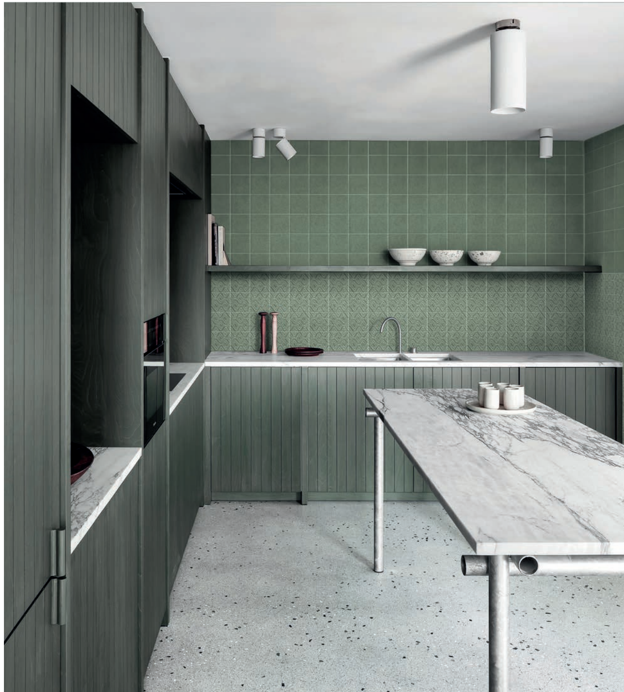
wall: ORIGINI FOREST . 15x15 / 6"x6" - FOREST 1 DINKA 15x15 / 6"x6"