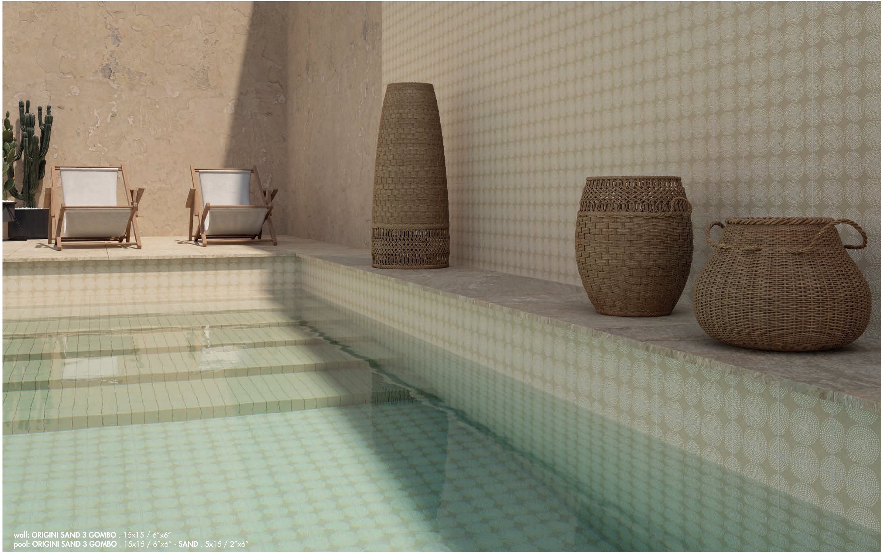
wall: ORIGINI SAND 3 GOMBO . 15x15 / 6"x6" pool: ORIGINI SAND 3 GOMBO . 15x15 / 6"x6" - SAND . 5x15 / 2"x6"