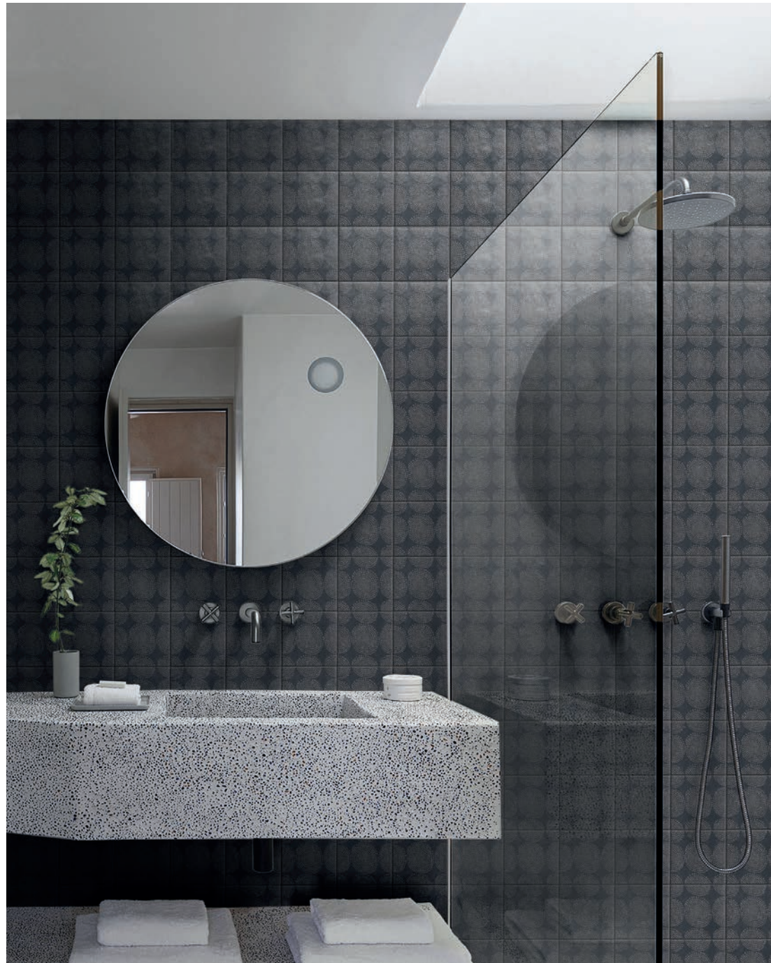
wall: CARBON 3 GOMBO 15x15 / 6"x6"