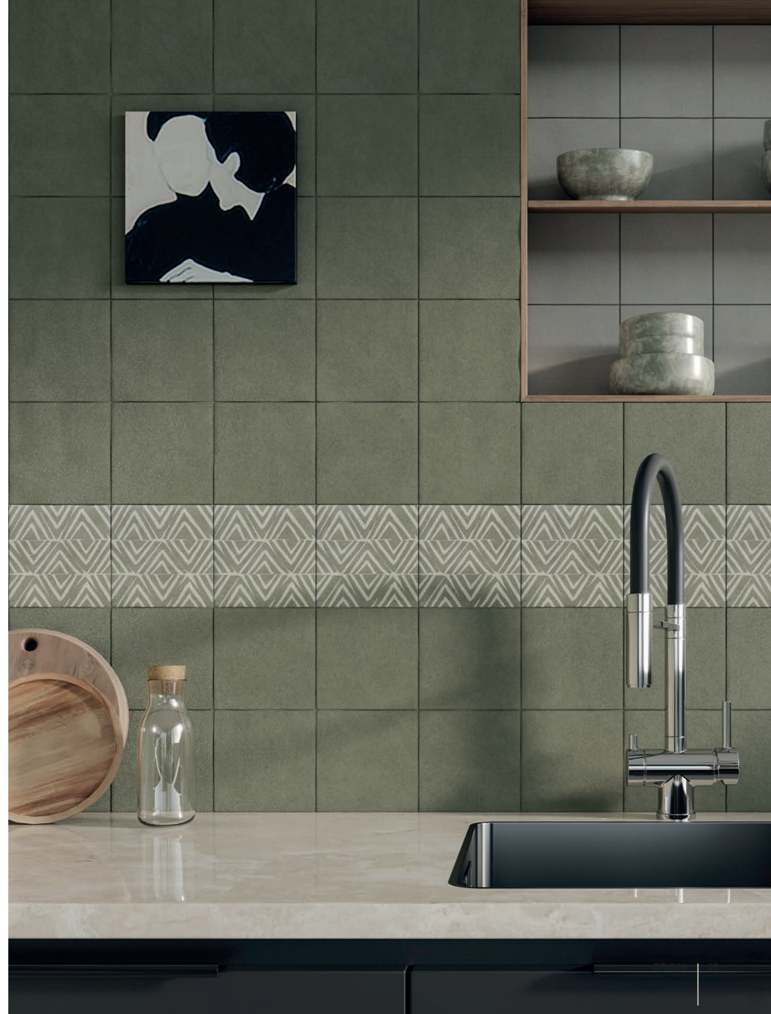
wall: ORIGINI FOREST . 15x15 / 6"x6" - FOREST 1 DINKA 15x15 / 6"x6"