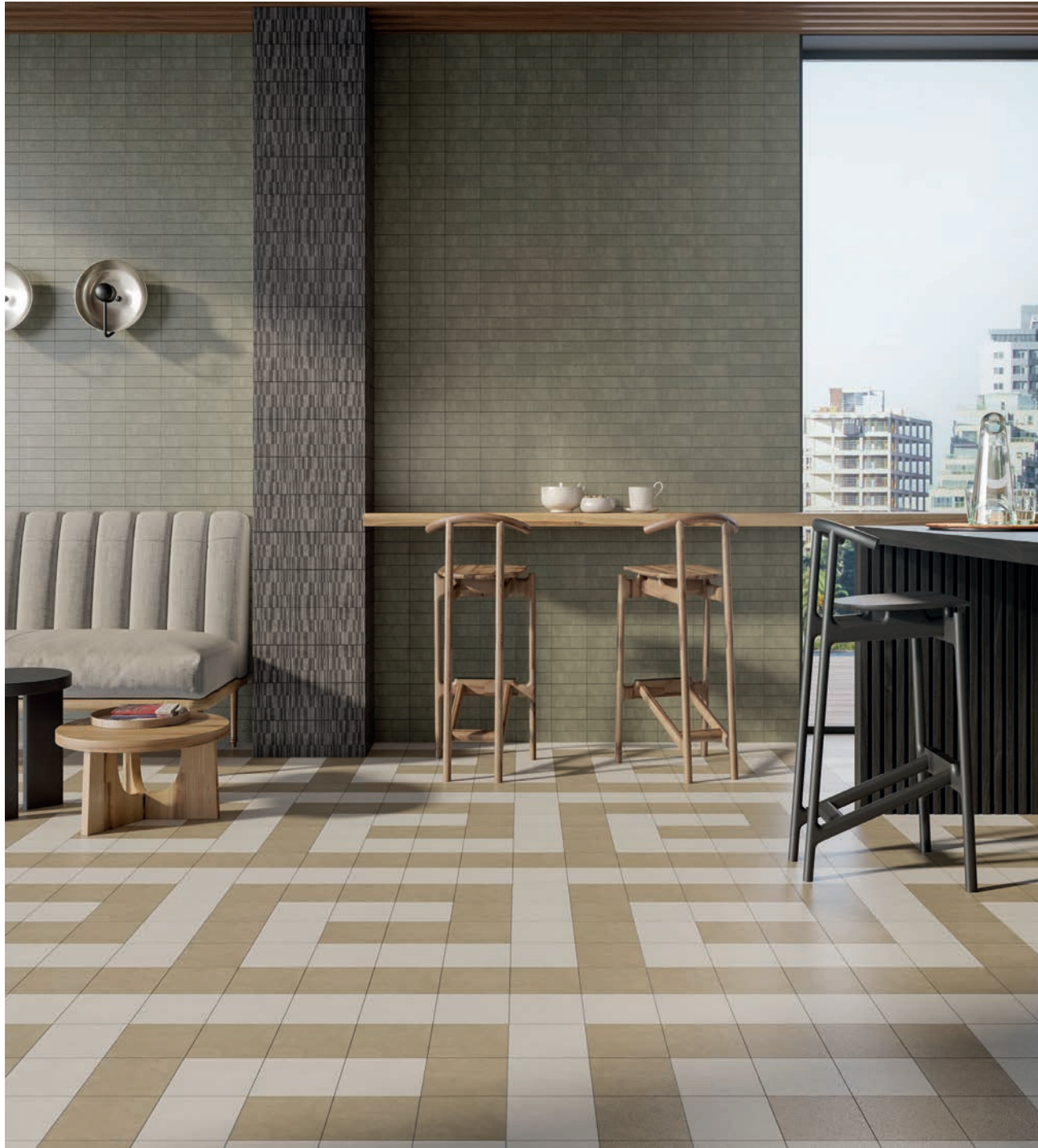
wall: ORIGINI FOREST . 5x15 / 2"x6" - CARBON 4 OWU15x15 / 6"x6" floor: ORIGINI ICE - SAND . 15x15 / 6"x6"