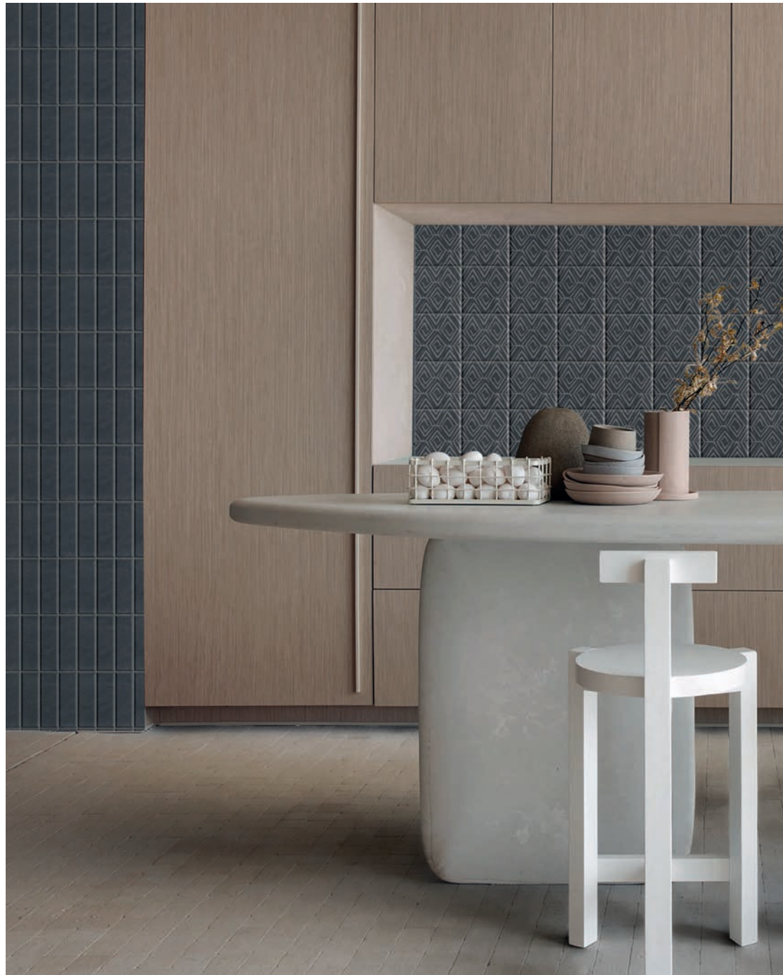
wall: ORIGINI CARBON . 5x15 / 2"x6" - CARBON 1 DINKA 15x15 / 6"x6"